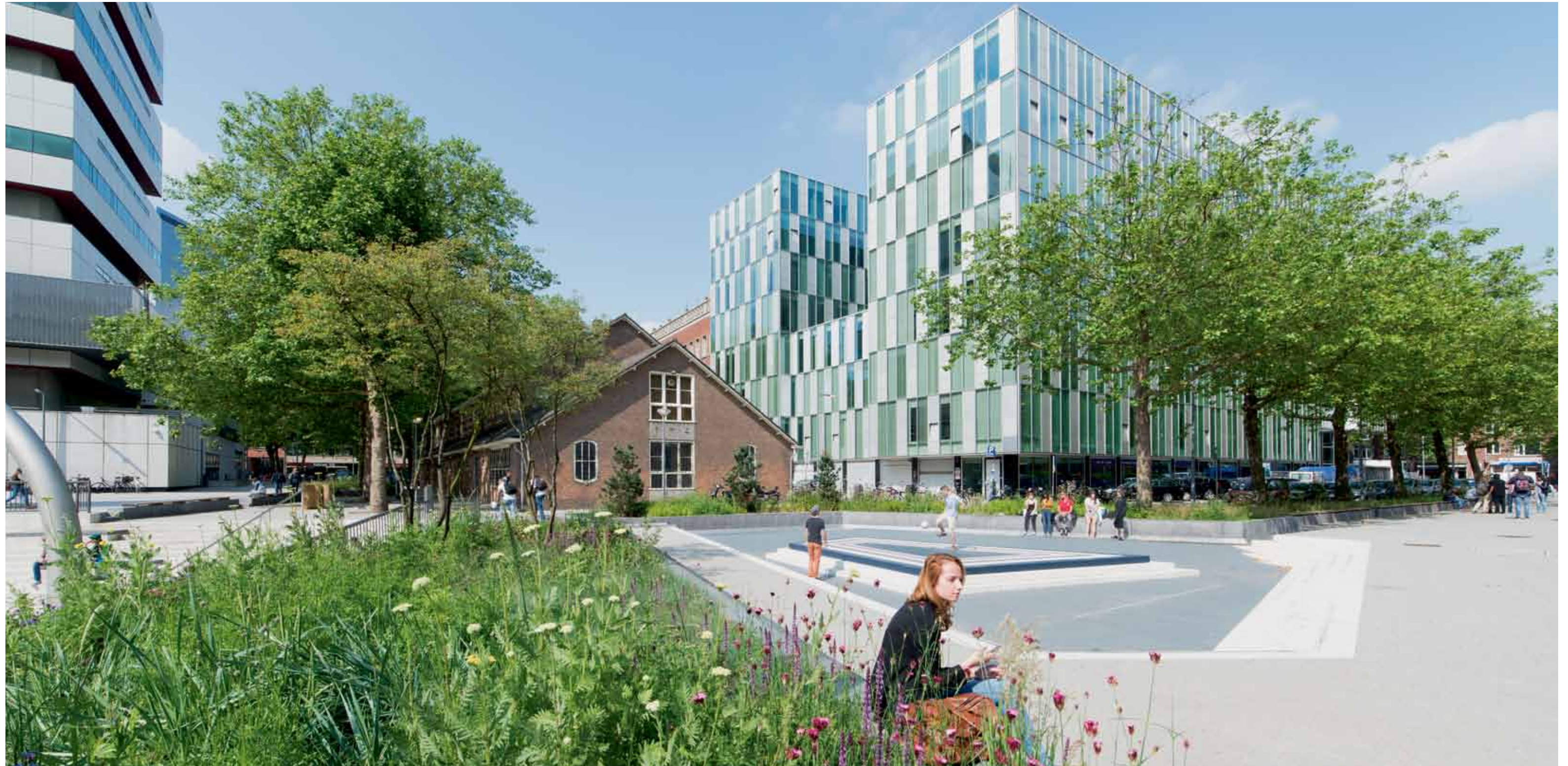
Het langwerpige bassin ligt in het verlengde van de kerk. Dit is het domein van de skaters.