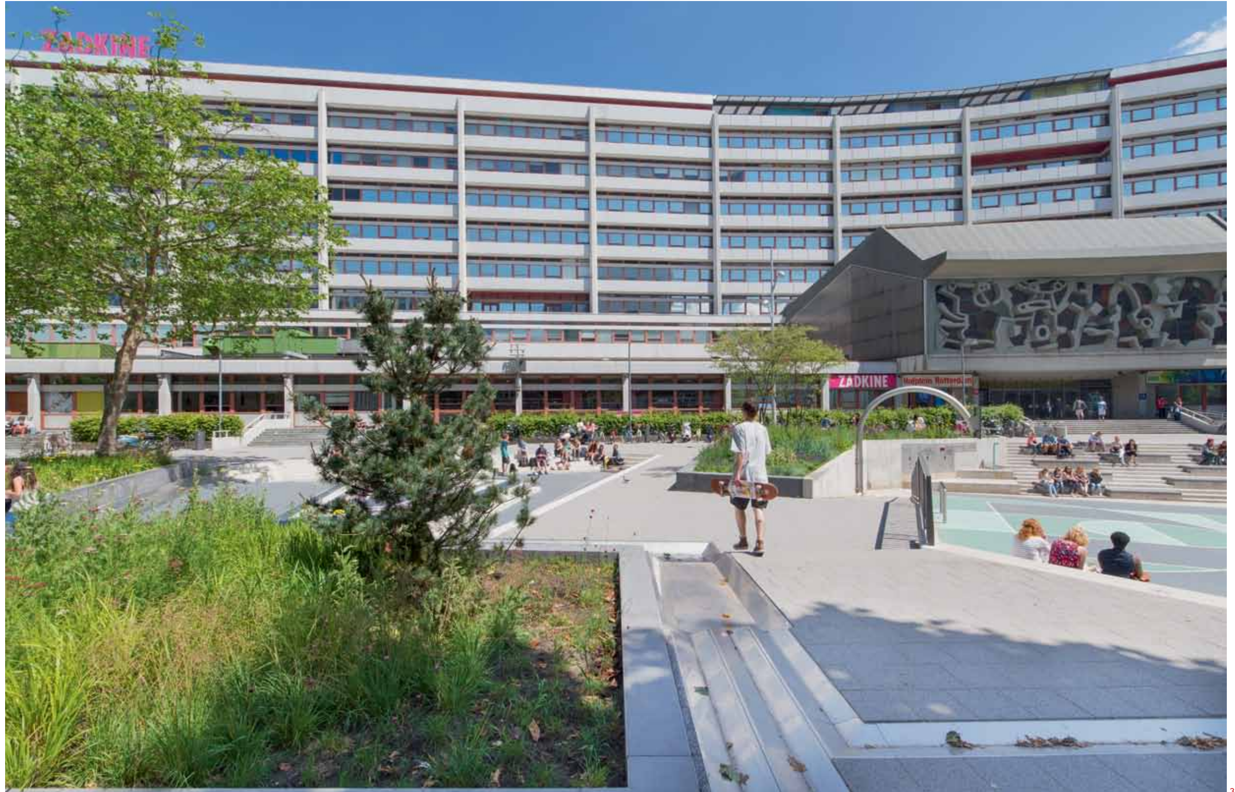
1 Een langwerpige border met bomen en zitjes wordt geflankeerd door een stalen goot. 2 De trappen zijn uitgerust met willekeurig geplaatste zitstenen.